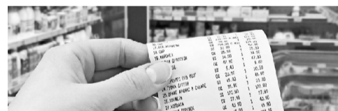
Шаг 1. Зафиксируйте информацию о цене, размещенную на ценнике

При выявлении несоответствия цен на ценниках и чеках рекомендуется придерживаться следующего алгоритма.